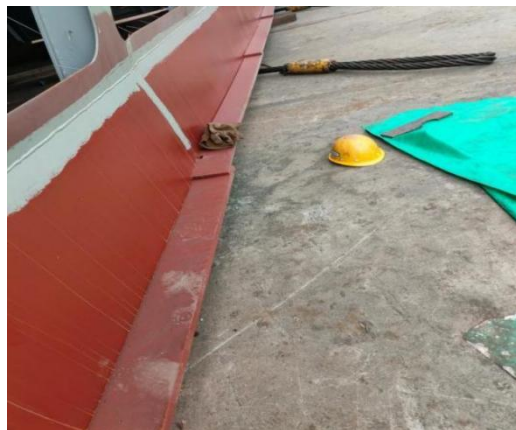
图 3 踩踏脚印

事故发生在 L3 加强构件处，该处 M61 分段下部为 0.95 米高的钢板围壁，上部为与水平线呈 72.4^\circ 夹角向外倾斜的 1.5 米×1.2 米窗孔，围壁外侧最下端水平方向焊有 H200 工字钢，在窗孔下方的工字钢上有明显的踩踏脚印。