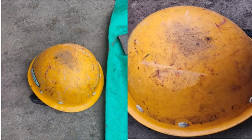
图4 安全帽上的剐蹭痕迹

L3 加强构件整体向南倾倒在地面，重约 1.2 吨，L3 加强构件北部为东西向 H360 工字钢，长 10 米，H360 工字钢上焊接有三根槽钢、一根工字钢，其中东、西端向内倾斜各焊接一根斜撑 C320 槽钢 A、B，分别长 2.9 米、3.2 米，中部垂直焊接一根长 2.8 米的 C320 槽钢 C，东端另垂直焊接一根长 2.68 米的 H400 工字钢，H400 工字钢北端有一吊耳。