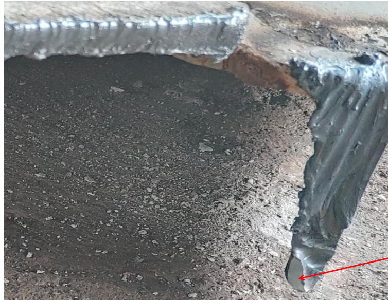
图 6 槽钢 A 南端切割部位

位有一约 1 厘米×2 厘米的白色光滑区域，其余所有的加强构件与 M61 分段之间的切割部位均为灰色不平整形状。