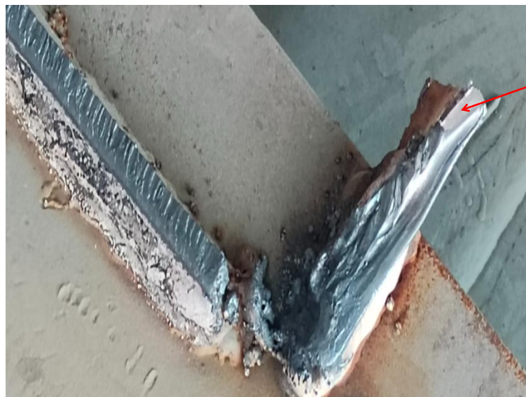
图 7 M61 分段顶部对应的槽钢 A 切割部位