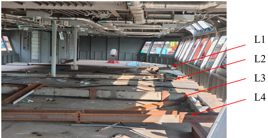
图 2 M61 分段内加强构件 L1-L4 已倾倒

事故发生在 L3 加强构件处，该处 M61 分段下部为 0.95 米高的钢板围壁，上部为与水平线呈 72.4^\circ 夹角向外倾斜的 1.5 米×1.2 米窗孔，围壁外侧最下端水平方向焊有 H200 工字钢，在窗孔下方的工字钢上有明显的踩踏脚印。